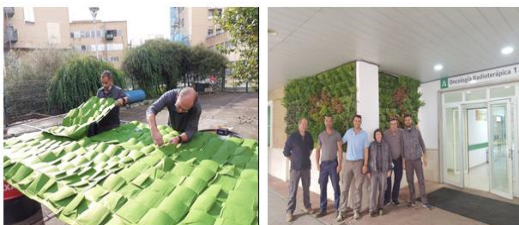
Figura 5: Equipo de jardinería del HUVR en la elaboración y ejecución del Jardín vertical a la entrada principal de Oncología Radioterápica.