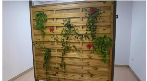
Figura 12: estructura de madera con plantas para separar espacios aportando una imagen acorde con este nuevo entorno ajardinado.