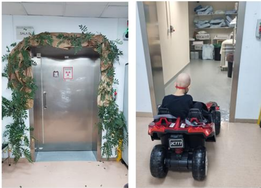
Figura 9: Fotos en las Unidades de Tratamiento con mascotas virtuales favoritas.