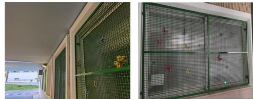
Figura 4: Túnel de acceso a la entrada principal de Oncología Radioterápica donde se han pintado los techos de color celeste, las rejas de las ventanas de color verde y se han colocado mariposas de colores.