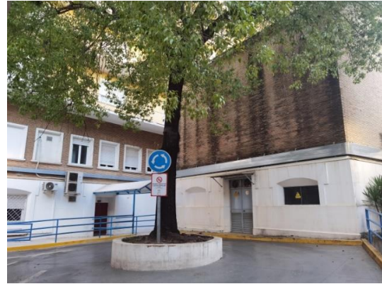
Figura 2. Glorieta frente a la entrada principal de Oncología Radioterápica donde se prevé en la segunda fase del proyecto (Enero-Julio 2023) un espacio ajardinado y un mural de grafiti en la pared de ladrillo visto.