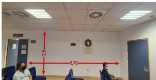
Figura 3: Pared de Sala de espera donde hay ya presupuestado por parte del Hospital un mural con un Entorno Natural de continuidad con luminosidad y profundidad al Jardín de la Rterapia.